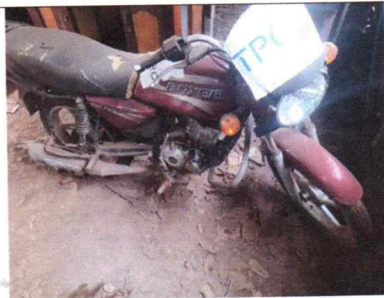
Figure 4.MOTO BOXER, plaque 134AU