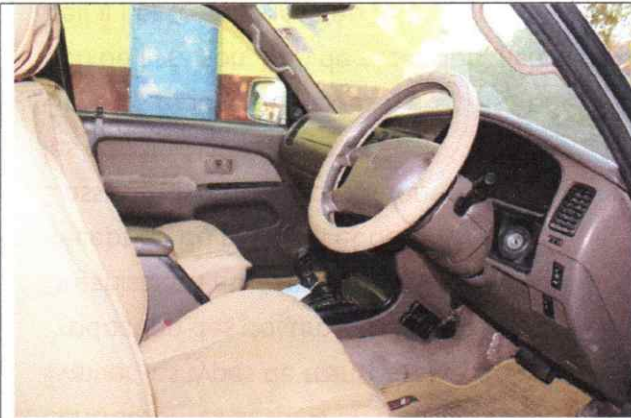
Figure 7.Véhicule_Plaque :1753AA/24