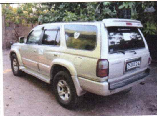
Figure 5.VEHICULE_Plaque :1753AA/24