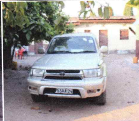
Figure 6.Véhicule_Plaque : 1753AA/24