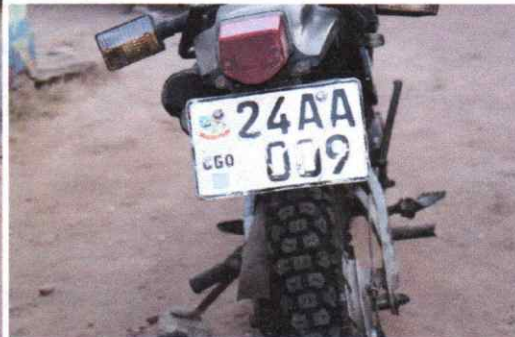
Figure 9.Moto_Plaque :24AA009