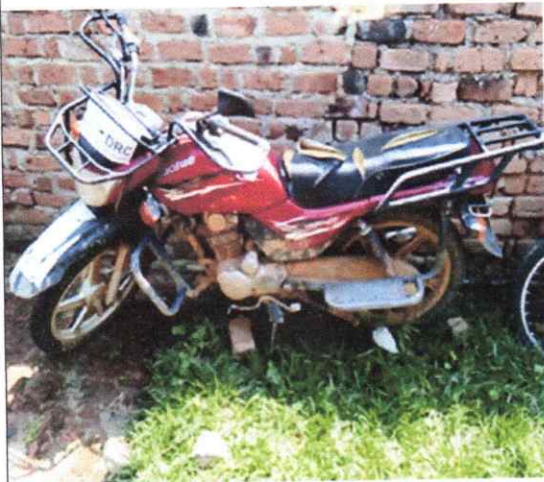
Figure 1.HAUJUE,plaque SK 344 AM