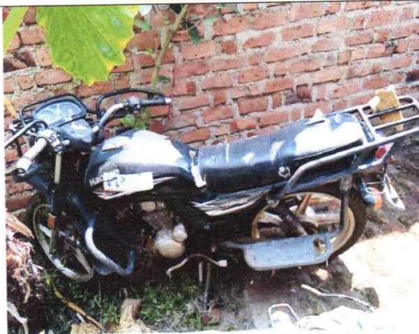
Figure 3.HAUJUE, plaque SK 342 AM