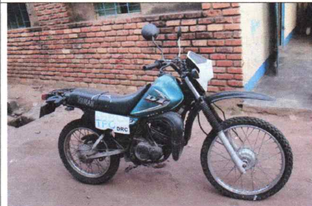
Figure 8.Moto_Plaque : 24AA009