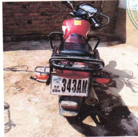
Figure 2.HAUJUE, plaque SK343 AM